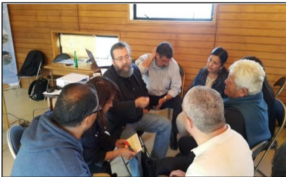
Caleta Coliumo, Región del Biobío

Tras la evaluación preliminar de la información recogida en los Talleres de Sensibilización, se pudo determinar que los pescadores artesanales y acuicultores de pequeña escala de las cuatro caletas muestran un interés común por desarrollar, a nivel local, las prácticas de adaptación asociadas a las áreas de acuicultura, repoblamiento de algas y actividades turísticas. Cada una de las iniciativas analizadas durante el taller, pretende hacer frente al cambio climático por medio de diferentes alcances, como la diversificación productiva, y el aprovechamiento de nuevas y/o mejores condiciones ambientales, entre otros.