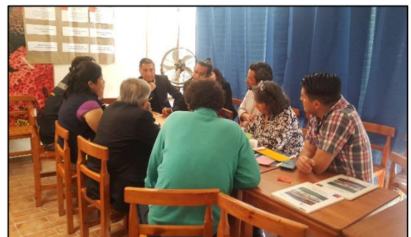
Caleta Tongoy, Región de Coquimbo

El análisis preliminar de los Talleres de Sensibilización también arrojó que las comunidades costeras buscan desarrollar prácticas innovadoras para enfrentar de mejor forma los impactos negativos del cambio climático como lo son: la generación de arrecifes, establecimientos de sellos de identidad, producción agroecológica y otras, que están siendo evaluadas.