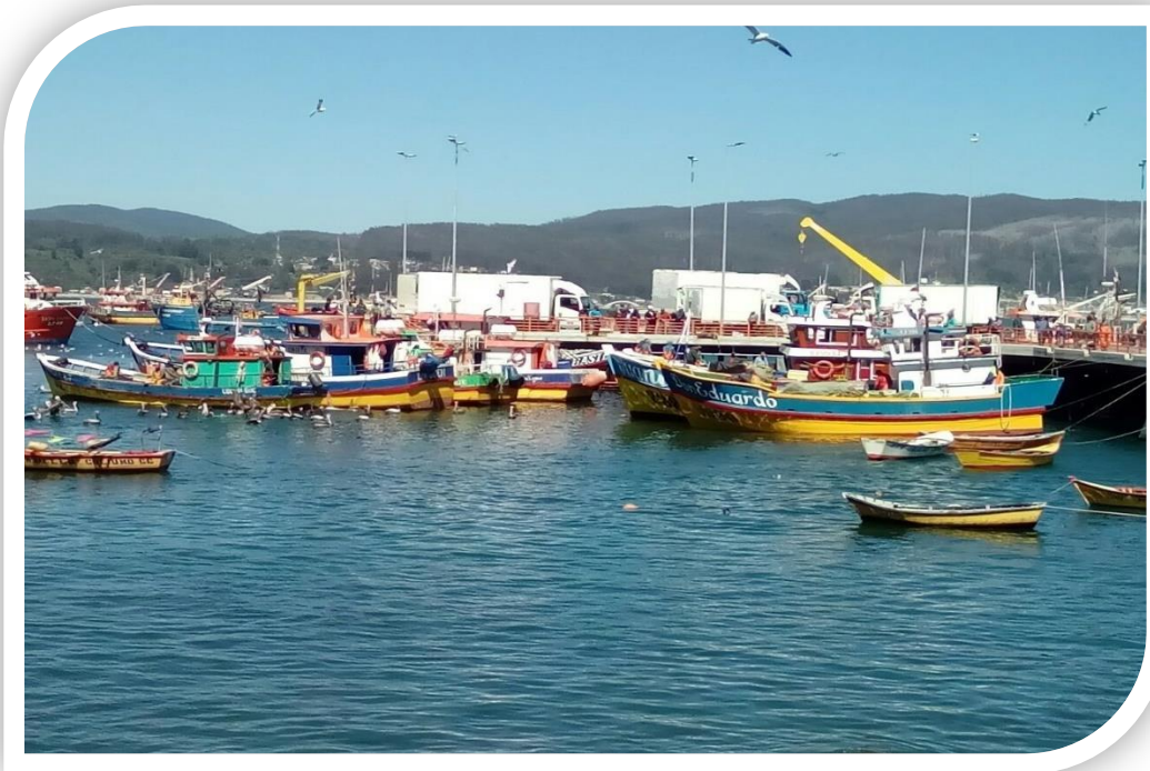
Caleta Coliumo, Región de Biobío.