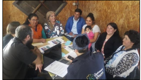
Caleta El Manzano-Hualaihué, Región de Los Lagos

Una activa participación tuvieron los socios beneficiarios, ejecutores y estratégicos, en el desarrollo de los Talleres de Sensibilización que se llevaron a cabo entre el 28 de noviembre y 12 de diciembre de 2017 en Caleta Riquelme, Región de Tarapacá; Caleta Tongoy, Región de Coquimbo; Caleta Coliumo, Región del Biobío y Caleta El Manzano, en la Región de Los Lagos.