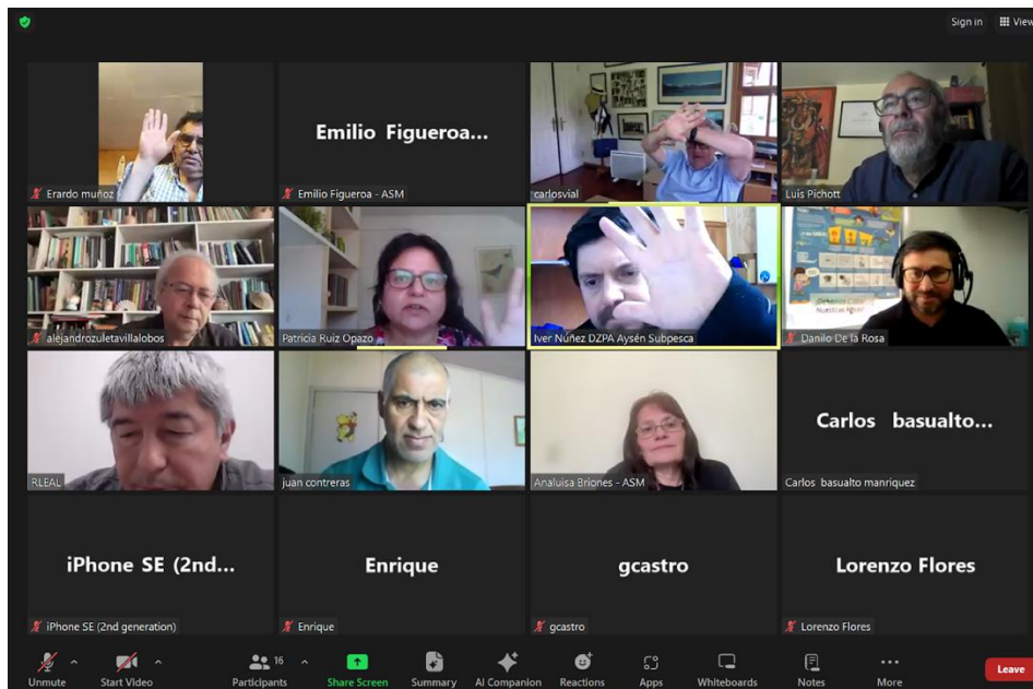
Detalle de asistencia al final de la sesión