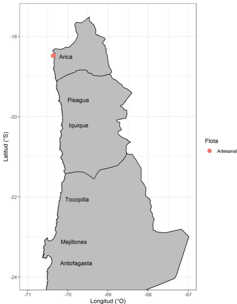
Figura 1 Procedencia de anchoveta para el an3lisis de la condici3n reproductiva, semana 44

En la Semana 44 , el an3lisis histol3gico se sustent3 de 71 hembras (2 muestreos), las que se recolectaron en la zona de Arica, a partir de muestreos de la actividad artesanal ( Tabla 1, Figura 1 ). Los tama1os fluctuaron entre 9,0 y 12,5 cm (moda 11,5 cm; 72% bajo 12,0 cm). En puertos de Iquique y Mejillones, la mala condici3n del recurso muestreado no permiti3 la toma de datos biol3gicos con extracci3n de g3nadas.