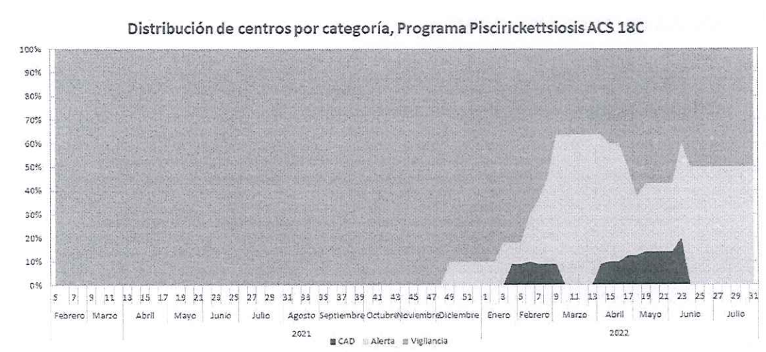
Figura N° 2. Proporción de centros según categoría, PSEVC-Piscirickettsiosis, ACS 18C..

En la Figura N° 2, se presenta la proporción de los centros de cultivo según su categoría