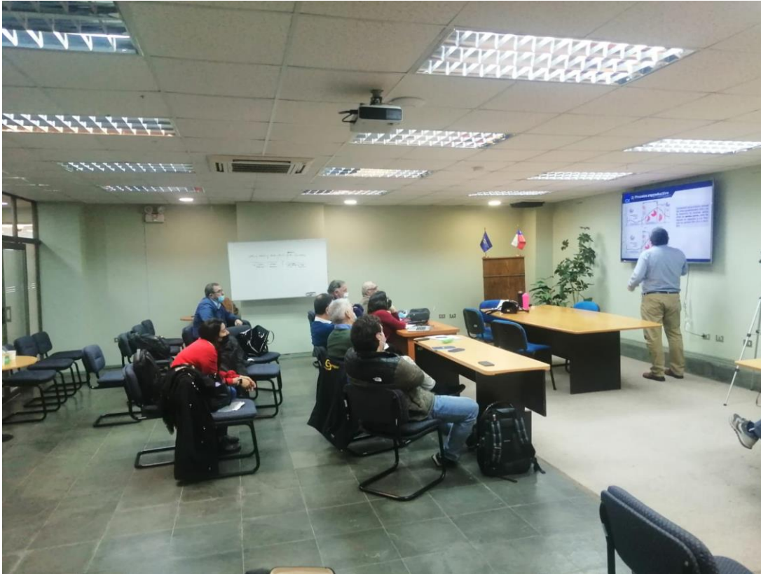
(Imagen 1. Registro asistencia presencial).