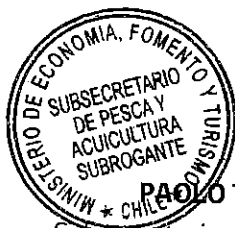
PAOLO TREJO CARMONA Subsecretario de Pesca y Acuicultura (S)