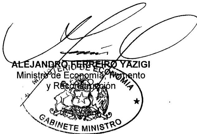
ALEJANDRO FERREIRO YAZIGI Ministro de Economía, Fomento y Reconstrucción