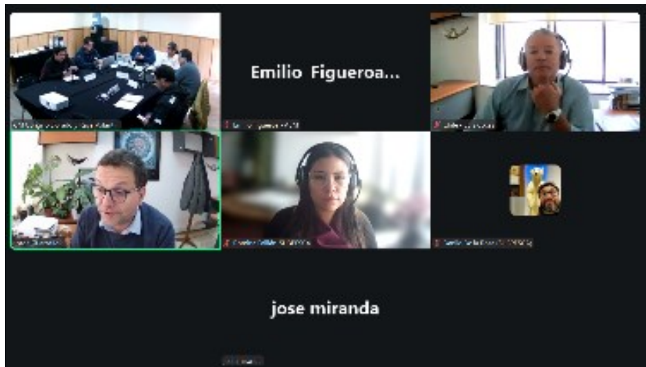
Imagen de asistencia virtual durante sesión del 1 de abril de 2026