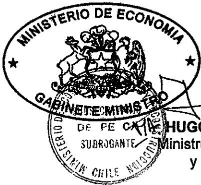
MICHELLE BACHELET JERIA Presidenta de la República

HUGO LAVADOS MONTES Ministro de Economía, Fomento y Reconstrucción.