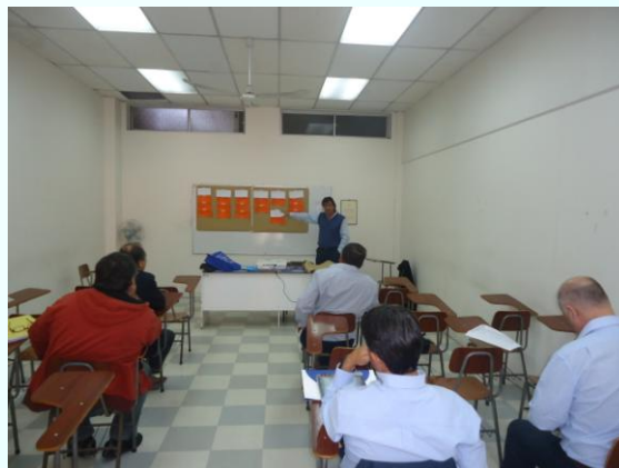
Sector Industrial 11.07.17

Representantes del sector pesquero artesanal e industrial de la Región de Arica y Parinacota trabajaron por separado en la definición de los principales problemas y vulnerabilidades de la actual ley.