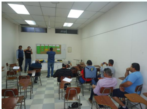
Sector Artesanal 10.07.17

En Talleres Participativos de Evaluación Ley de Pesca