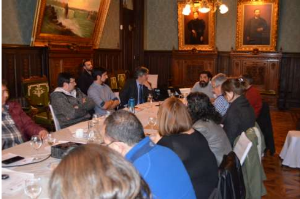
Figura 1: Sesión N° 7 del Comité de Manejo de Centolla y Centollón, Región de Magallanes y Antártica chilena.