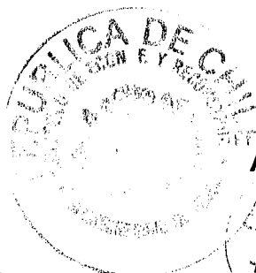
ALEJANDRO FERREIRO YAZIGI Ministro de Economía, Fomento y Reconstrucción