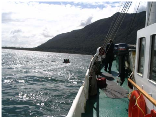
Figura 2: Embarcación se dirige a medición de Instalaciones en terreno