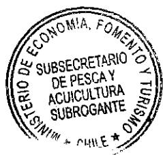
PAOLO TREJO CARMONA Subsecretario de Pesca y Acuicultura (S)

ANÓTESE, COMUNÍQUESE, PUBLÍQUESE EN EL SITIO WEB DE LA SUBSECRETARÍA DE PESCA Y ACUICULTURA Y ARCHÍVESE.