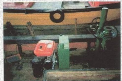
Virador hidraulico de lineas

Naves que utilizan este aparejo: Este tipo de aparejo de pesca es apropiado para casi cualquier tipo y tamaño de nave que pueda operar en el área de pesca. También puede ser utilizado sin embarcación, directamente desde la costa (muelles, rocas, playas).