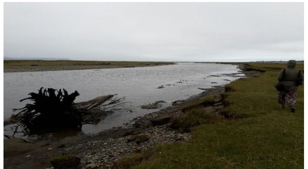
Humedal Hualaihué, Región de Los Lagos