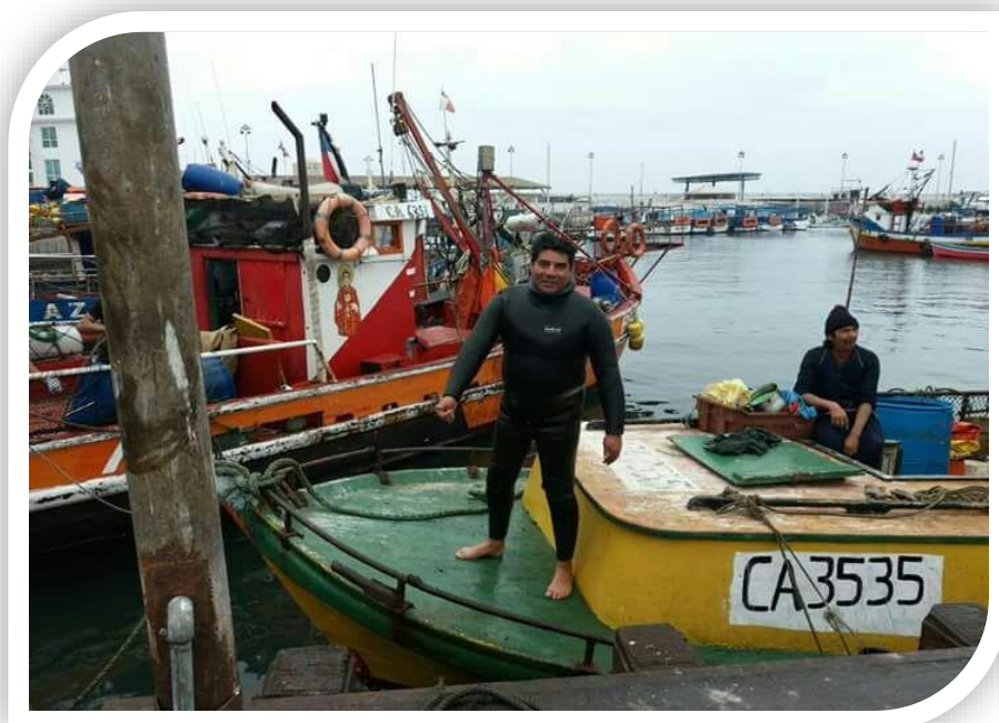
Caleta Riquelme, Región de Tarapacá.