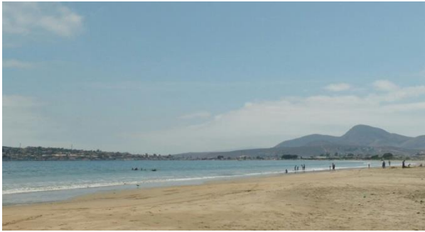
Humedal de Tongoy, Región de Coquimbo

Del trabajo en conjunto realizado entre los pescadores artesanales, acuicultores de pequeña escala y socios estratégicos del proyecto surgió el desarrollo del turismo como una práctica adaptativa al cambio climático. En esta línea, y según los datos y cifras que maneja el Servicio Nacional de Turismo (SERNATUR), el turismo es un sector económico que cobra cada año mayor importancia por su aporte a las economías locales, la generación de empleos, la preservación de los valores culturales y las tradiciones del país, la conservación del medio ambiente y la promoción de la inclusión social. En este enfoque, el desarrollo de un turismo sustentable en la pesca y la