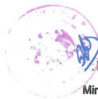
MICHELLE BACHELET JERIA Presidenta de la República