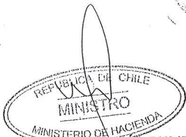
RODRIGO VADES PULIDO Ministro de Hacienda