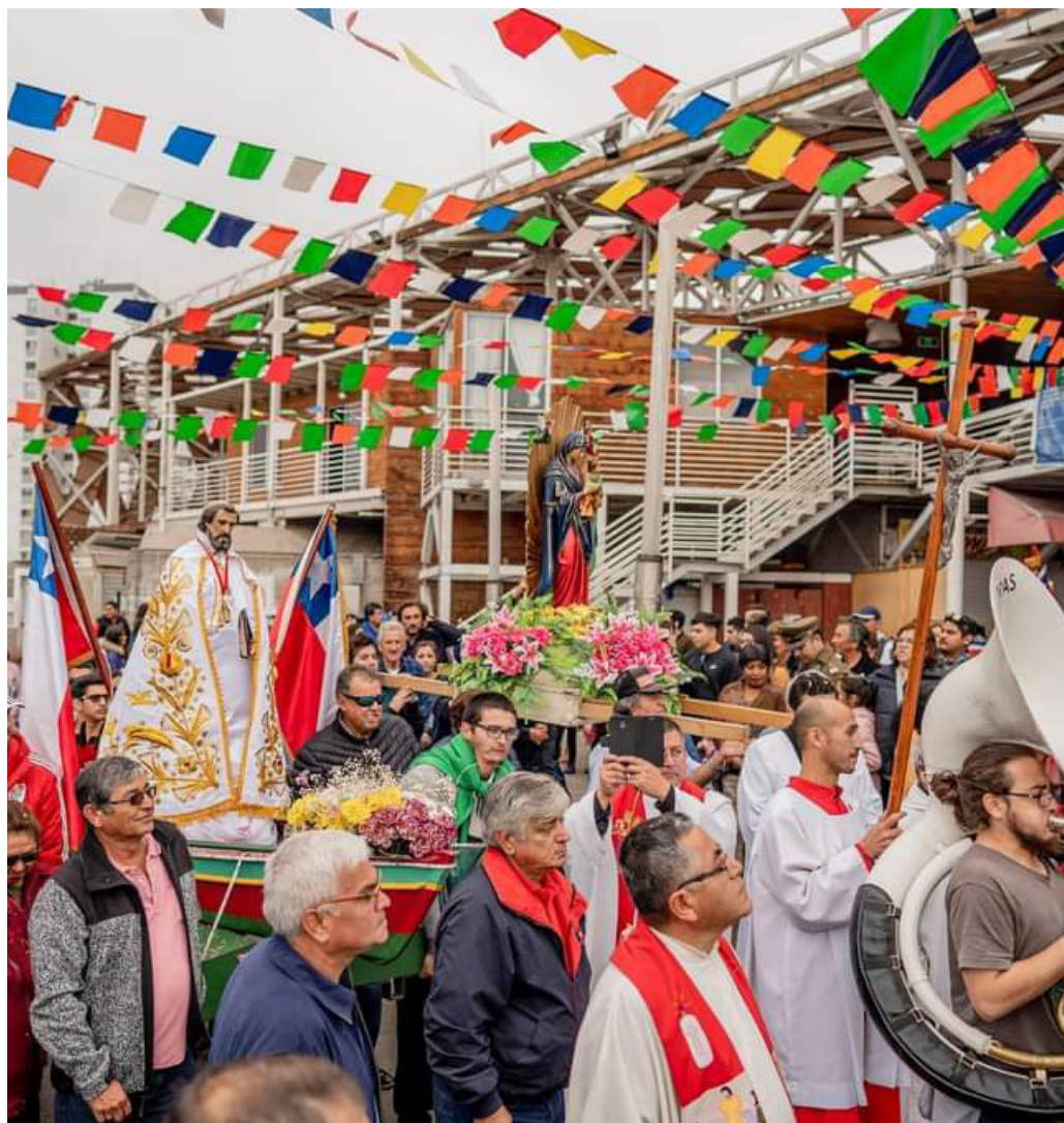
FIGURA 13 Celebración de San Pedro, Caleta Riquelme, Iquique

Fueron los pescadores de la extinta Caleta El Colorado quienes llevaron la celebración de la festividad de San Pedro a Caleta Riquelme, puesto que antes de su arribo a la misma, las celebraciones se realizaban en Caleta El Colorado y la Parroquia Nuestra Señora del Perpetuo Socorro (Figura 9).