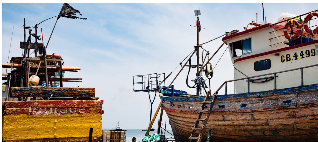
FIGURA 4 Sector varadero

El sector de varadero de embarcaciones, ubicado frente a la edificación principal es un lugar de atractivo especial (Figura 4). En él los visitantes tienen la oportunidad de dimensionar el tamaño de las embarcaciones pesqueras y observar el trabajo de los carpinteros de ribera (Figura 5) y de los rederos que reparan y arman los artes y aparejos de pesca, siendo un buen lugar para conocer acerca de estos oficios.