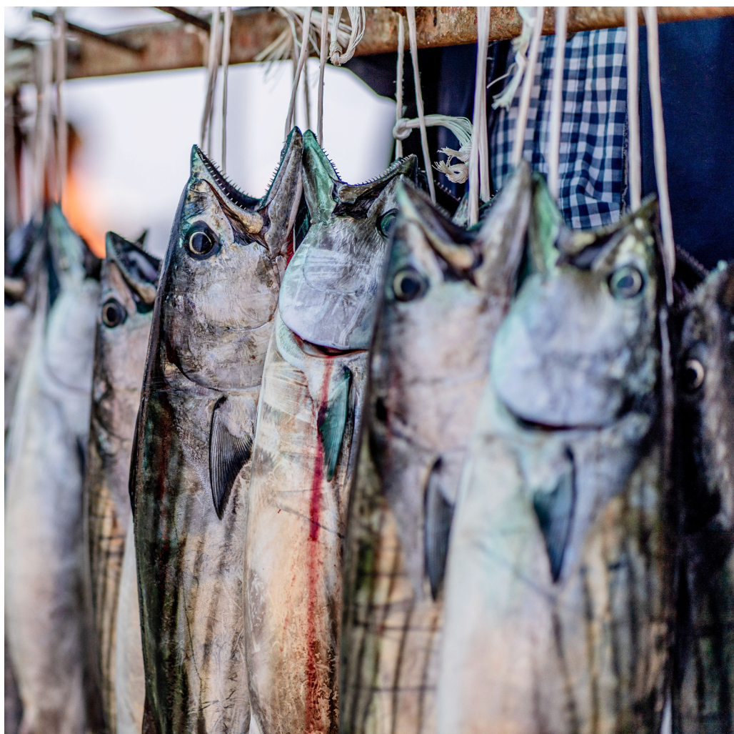
FIGURA 6 Venta de pesca del día en el muelle de pescadores

En el muelle, los visitantes pueden observar desde una distancia segura, el desembarque de los recursos pesqueros capturados en las faenas de pesca, como albacoras, bacalaos, tiburones, palometas, recursos bentónicos, entre otros. En los momentos de inactividad, se pueden conocer las lanchas y botes atracados a él y contemplar la bahía y su fauna (Figura 6).