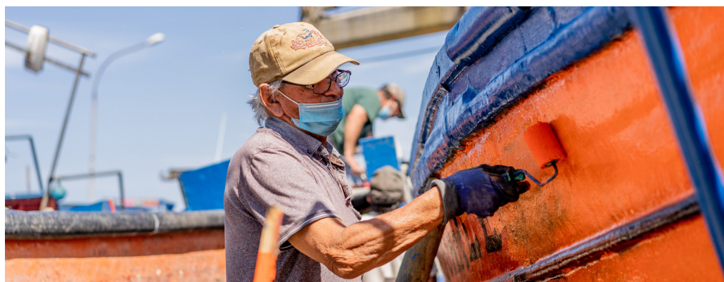
FIGURA 5 Carpintero desarrollando sus oficios

Nota: Embarcaciones pesqueras artesanales varadas en Caleta Riquelme para faenas de carenado (mantención y reparación de casco) y otras obras de mantención y reparación.