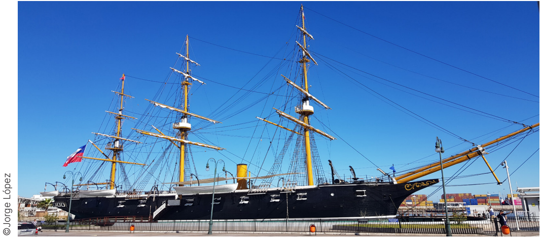
FIGURA 9 Réplica a escala real de la corbeta Esmeralda