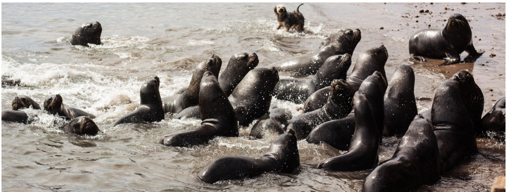
FIGURA 10 Lobo marino común ( Otaria flavescens )