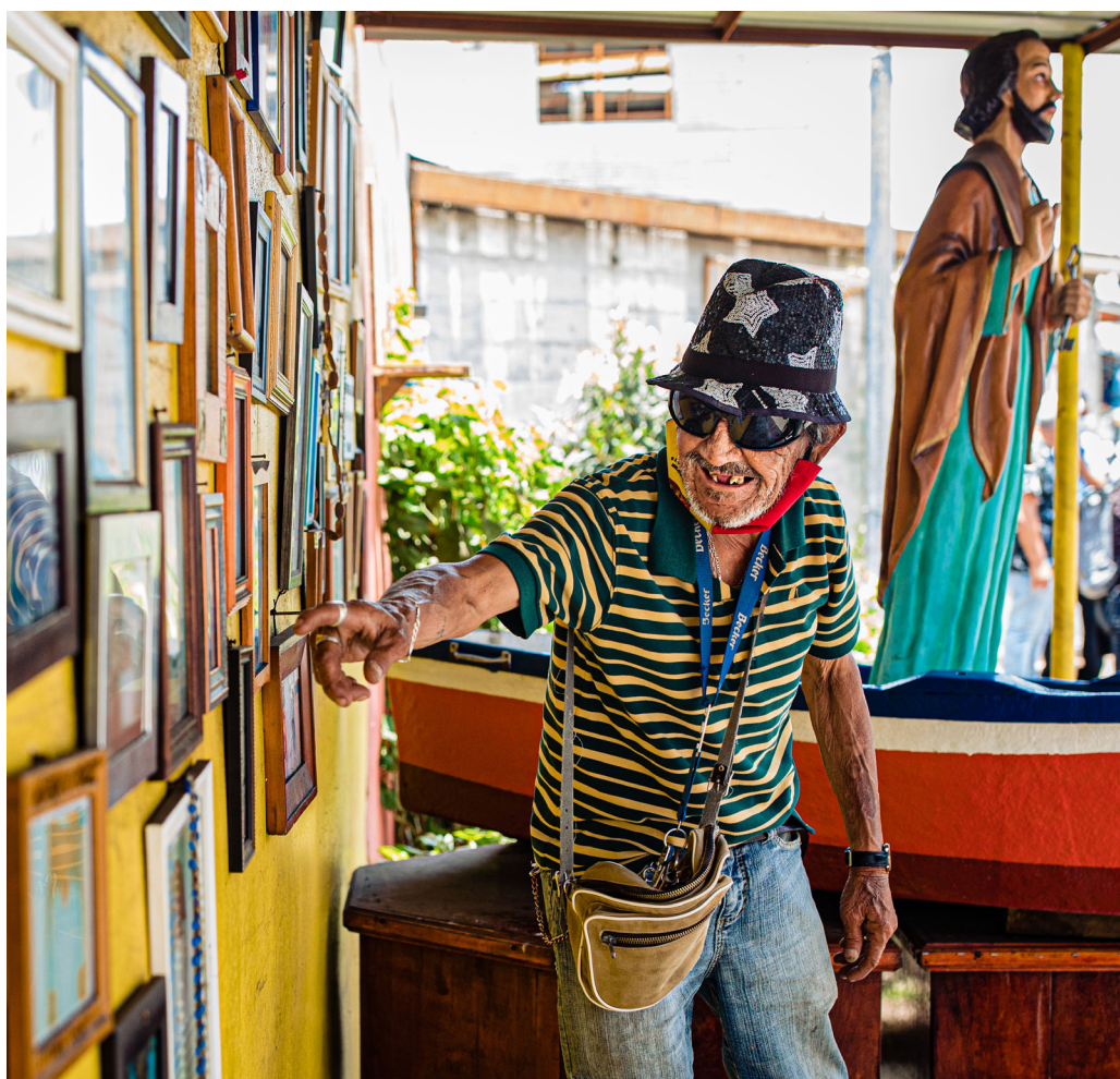
FIGURA 7 Imagen de San Pedro

Inmediatamente después del acceso vehicular de la caleta, existe un área verde donde está emplazada la imagen de San Pedro y de la Virgen María (Figura 7). San Pedro, de acuerdo con la tradición que data del siglo XIX, protege a los pescadores e intercede por los buenos frutos en la pesca. Allí también la comunidad rinde homenaje a sus compañeros fallecidos, manteniendo vivo su recuerdo a través de sus retratos.