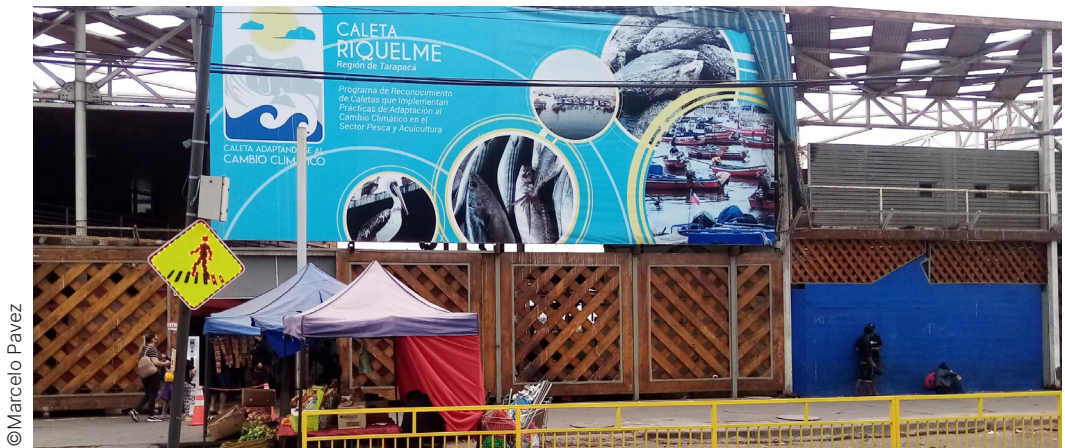
Imagen exterior de Caleta Riquelme posterior a las acciones de hermoseamiento consistentes en instalación de gigantografía y pintado de fachada (abril 2021)

Además, la obtención de algunos de los productos esperados, está vinculada a la implementación del Acuerdo de Producción Limpia “Pesca sustentable en Caleta Riquelme, Iquique”, iniciativa impulsada por la Comisión de Pesca y Acuicultura del Comité Regional de Cambio Climático (CORECC) y emprendida por la Agencia de Sustentabilidad y Cambio Climático y la Corporación Norte Pesquero en beneficio de algunas de las empresas de la localidad, representadas por la Corporación de Pescadores y Buzos Artesanales de Iquique.