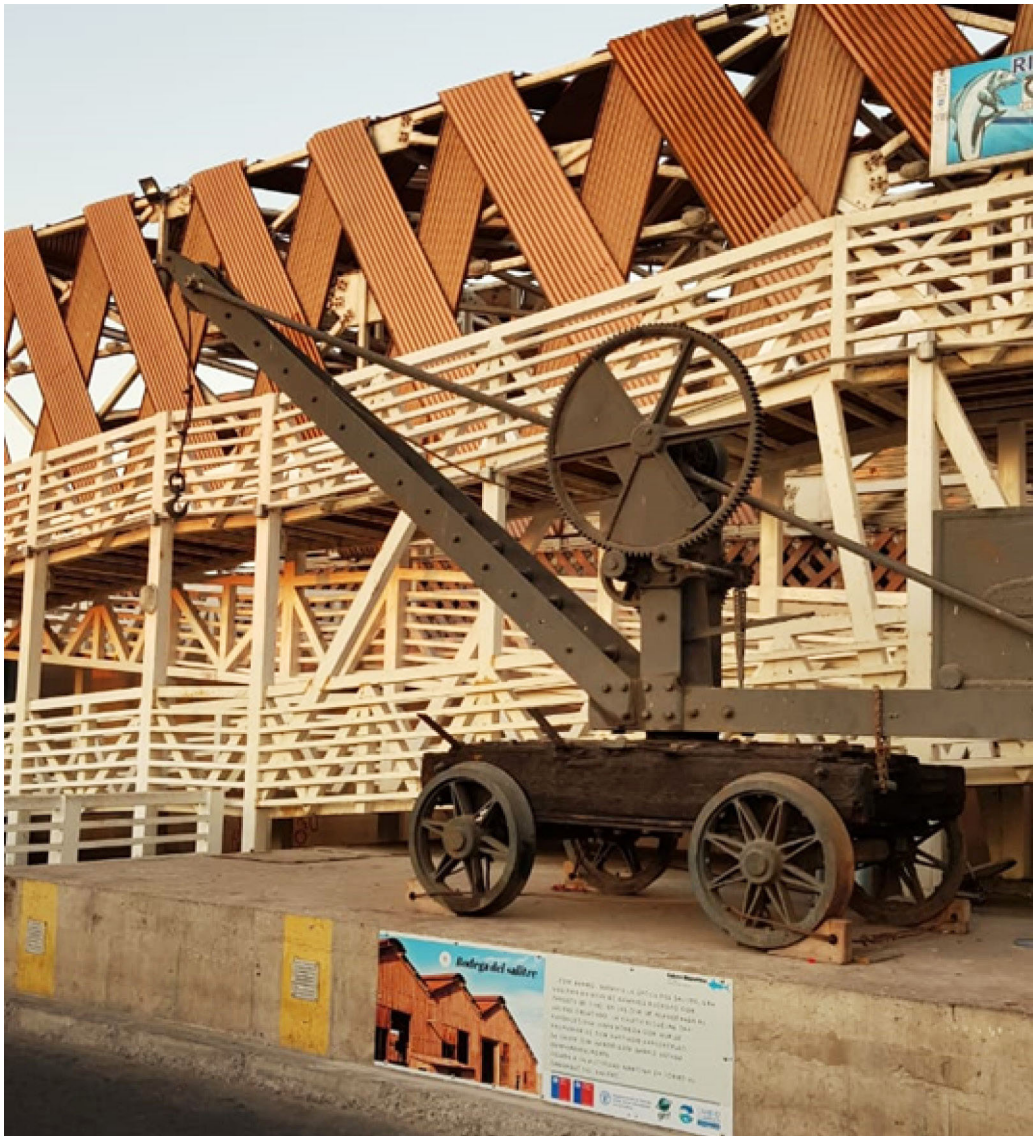
FIGURA 8 Grúa de levante

Por último, frente al área verde antes mencionada, se encuentra un vestigio del patrimonio histórico de la región asociado a la época del salitre, que consiste en una grúa de levante instalada sobre un carro de pino Oregón (Figura 8), de la cual, no se ha encontrado más información que su procedencia inglesa y marca Westminster.