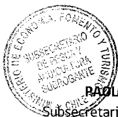
PAOLO TREJO CARMONA Subsecretario de Pesca y Acuicultura (S)

ANÓTESE, NOTIFÍQUESE POR CARTA CERTIFICADA AL INTERESADO, PUBLÍQUESE EN EL SITIO WEB DE ESTA SUBSECRETARÍA Y ARCHÍVESE.