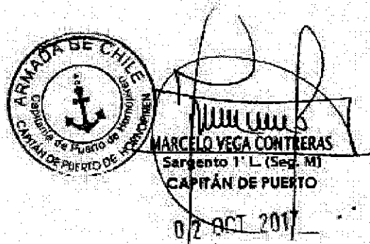
Figura 1. Ubicación de polígono solicitado y visado por Capitanía de Puerto, para la instalación de 30 líneas dobles con colectores de chorito al interior del AMERB "Puntilla Quillón Sector A", X Región de Los Lagos.