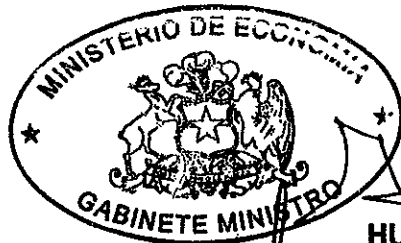
MICHELLE BACHELET JERIA Presidenta de la República

HUGO LAVADOS MONTES Ministro de Economía, Fomento y Reconstrucción.