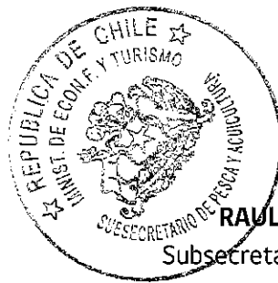
RAUL SUNICO GALDAMES Subsecretario de Pesca y Acuicultura.

ANÓTESE, PUBLÍQUESE EN EXTRACTO EN EL DIARIO OFICIAL Y EN UN DIARIO DE CIRCULACIÓN REGIONAL DE X REGIÓN Y A TEXTO INTEGRO EN EL SITIO DE DOMINIO ELECTRÓNICO DE LA SUBSECRETARÍA DE PESCA Y ACUICULTURA Y DEL SERVICIO NACIONAL DE PESCA Y ACUICULTURA.