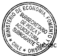
PAOLO TREJO CARMONA Subsecretario de Pesca y Acuicultura (S)