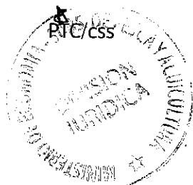
RAUL SUNICO GALDAMES Subsecretario de Pesca y Acuicultura

ANOTESE, NOTIFIQUESE POR CARTA CERTIFICADA, TRANSCRIBASE COPIA DEL INFORME TECNICO CITADO EN VISTO AL INTERESADO Y ARCHIVASE