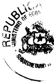
MICHELLE BACHELET JERIA Presidente de la República

ALEJANDRO FERREIRO YAZIGI Ministro de Economía, Fomento y Reconstrucción