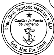
PATRICIO VILLARROEL NAVARRO SARGENTO 1° L. (SEG.M.) CAPITÁN DE PUERTO DE COCHAMÓ

DISTRIBUCIÓN: 1.- INTERESADO. 2.- ARCHIVO.