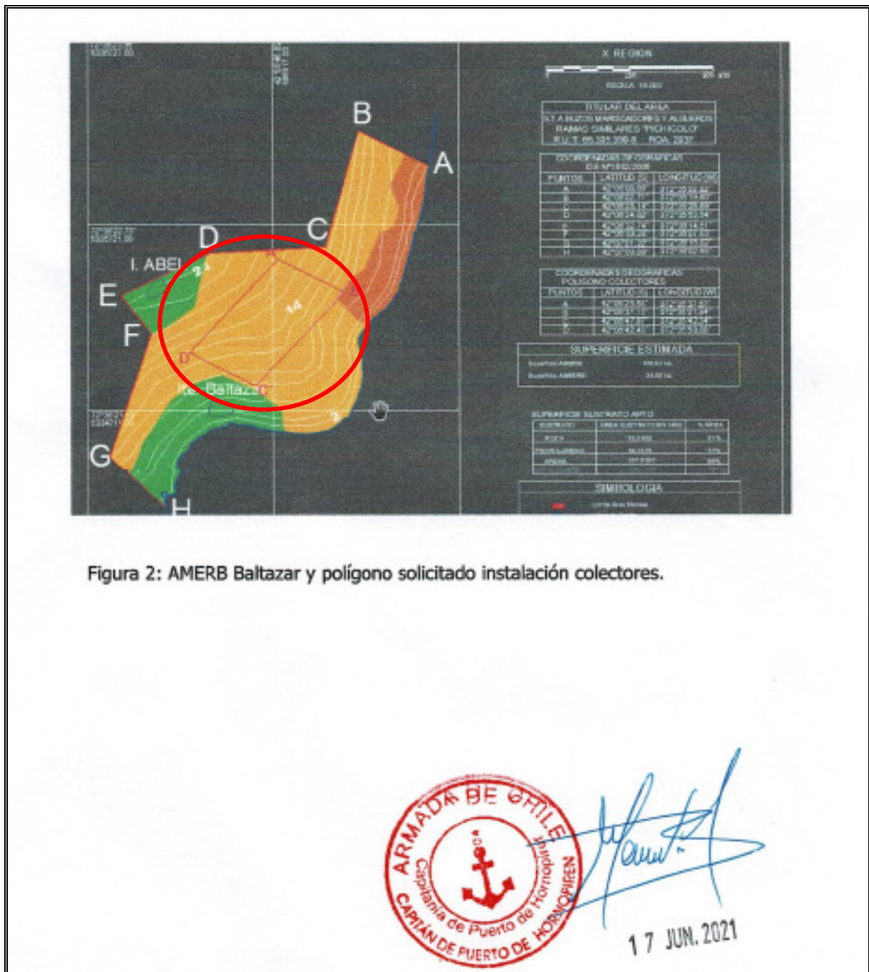
Figura 2: AMERB Baltazar y polígono solicitado instalación colectores.