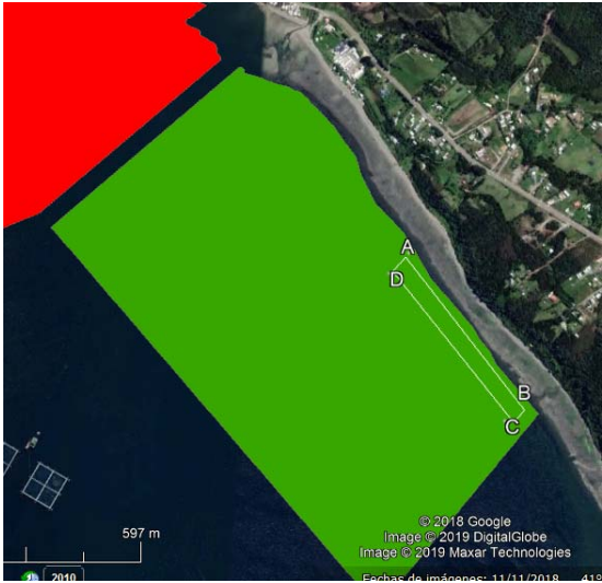
Área del AMERB destinada para realizar actividades de repoblación con frondas de (Línea punteada) Sarcothalia crispata .