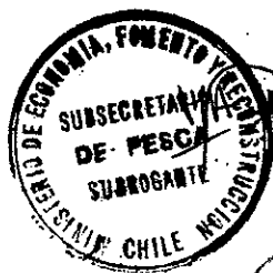
MICHELLE BACHELET JERIA Presidenta de la República

JEAN-JACQUES DUHART SAUREL Ministro de Economía, Fomento y Reconstrucción (S)