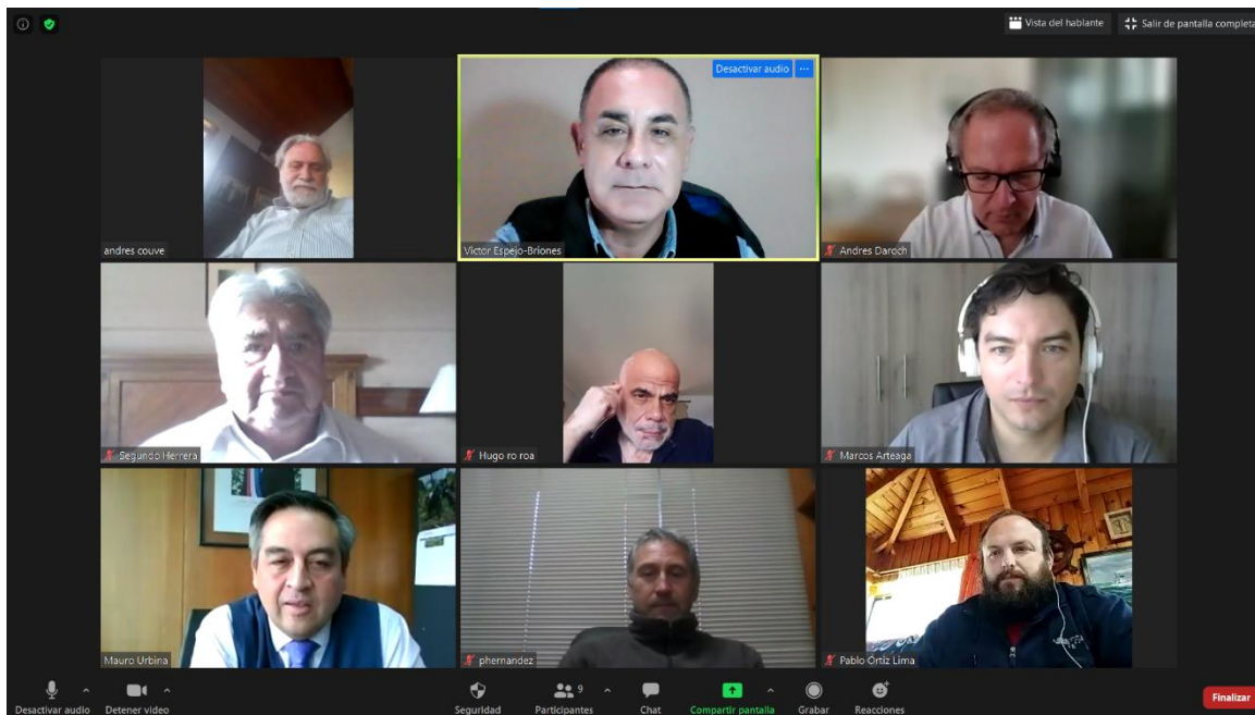
Imagen de asistencia de la sesión: