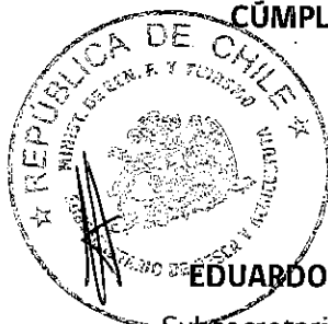
EDUARDO RIQUELME PORTILLA Subsecretario de Pesca y Acuicultura