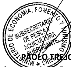
PAOLO TREJO CARMONA Subsecretario de Pesca y Acuicultura (S)