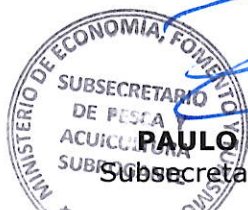
PAULO SEPÚLVEDA SEPÚLVEDA Subsecretario de Pesca y Acuicultura (S)

El texto íntegro del presente decreto se publicará en los sitios de dominio electrónico de la Subsecretaría de Pesca y Acuicultura y del Servicio Nacional de Pesca y Acuicultura.